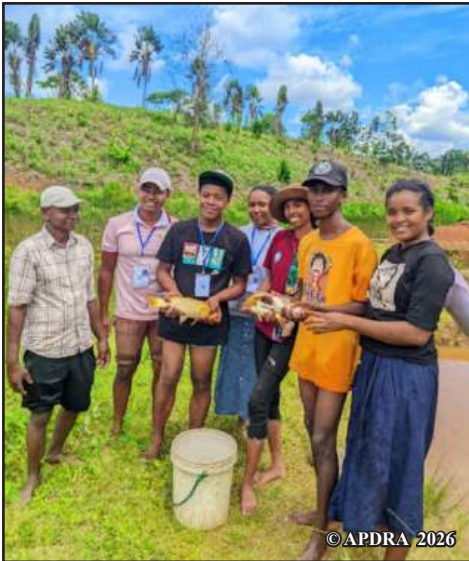
Fisafidianana ray aman-drenin-trondro sy fanavahana karpa nataon'ny tanora miofana ao amin'ny Ivotoerana IFTM

Milofa amin'ny fanamafisana ny fahaiza-manaon'ny mpampiofana ny Ivotoerana IFTM ao Niarovana Caroline hiantohana ny fiparahana ny fiompiana trondro. Hatramin'ny 2023, vokatry ny fiaraha-miasa tamin'ny APDRA, nofanina manokana mikasika ny fanajariana dobo barazy sy tanimbary fiompiana trondro ny mpampiofan'ny ivotoerana. Ny hahafahan'izy ireo mpianatra ny tanora ao amin'ny ivotoerana ny dingana ara-teknika rehetra takian'ny fametrahana sy ny fitantanana toeram-piompiana no kendrana amin'io fanofanana mpampiofana io. Anisan'ny fahaiza-manao azo ny asa famantarana ny