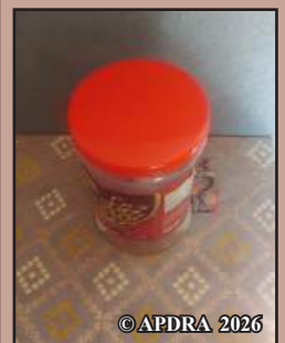
Azo tahirizina maharitra ny furikake