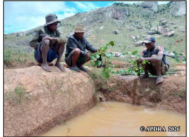
Mpiompy trondro ao Ambalabetsila

Miankina amin'ny toe-tsain'ny mpamokatra aloha ny faharetan'ny fiompiana trondro. Tokony hitady vahaolana hatrany isika manoloana ny fahasahiranana sedraina ary tsy mionona amin'ny fampiharana ny teknika omen'ny teknisianina.