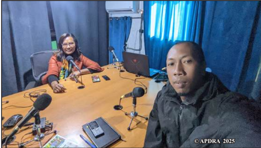
Fandraisam-peo ny fandaharana iray mikasika ny teknika fiompiana trondro an-tanimbary

Etsy ankilany, miezaka manatsara sy mampitombo ny vontoatin'ny fandaharana alefa ny APDRA. Asehon'ity fiaraha-miasa ity fa fitaovana mahomby ny radio eny ifotony amin'ny fanapariahana ny fiompiana trondro amin'ny alàlan'ny fampitana hafatra teknika amin'ny olona betsaka kokoa.