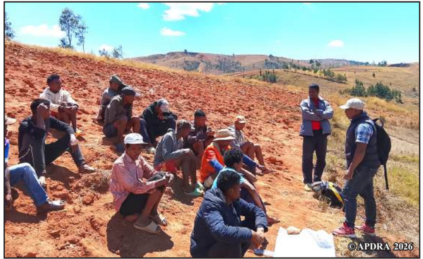
Mpiompy trondro ao anatin'ny fikambanana Fitiavana Fivoarana

Ankoatra ny fiompiana trondro, manao fanajariana tanety ihany koa ny fikambanana, hany ka mandray anjara amin'ny fiarovana ny sahan-driaka mamelona ny fari-pamokarana. Noho io fiaraha-mientana io dia hitan'ny Fitiavana Fivoarana fa tena nihatsara ny fahaizamaon'ny mpikambana ao aminy ary nitombo miandalana ny vokatra zana-trondro, ka mampaharitra ny seha-pihariana trondro eny ifotony.