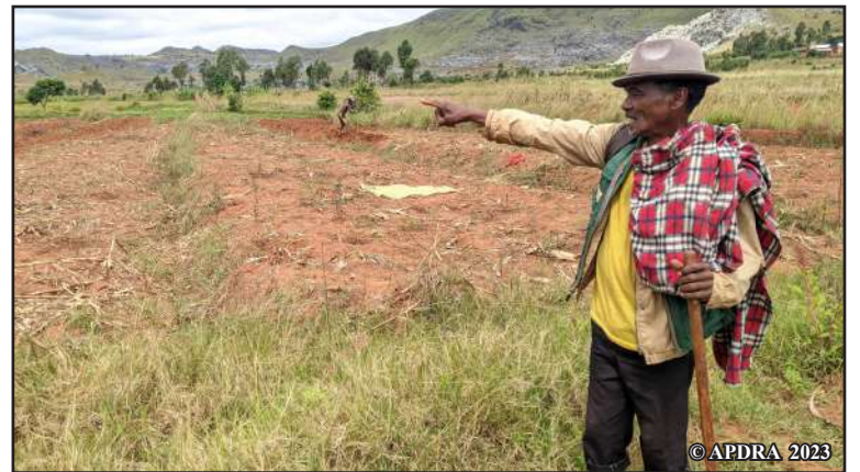
Razafimamonjy manoro ireo tanimbary taloha izay lasa toeram-pambolena katsaka, vomanga na voanjo.

fokontany roa manodidina, izany hoe zana-trondro 20 000, renintronro 3 sy raintronro 15. Vokatry'ireo fatiantoka ireo dia saika hanajanona ny fiompiany trondro ireo mpiompy sasany ao amin'ny Vovonana Kaominaly ivondronanay. Soa ihany fa nifankahery izahay amin'ny hanohizana ny famokarana trondro na eo aza izany fahavoazana izany. »