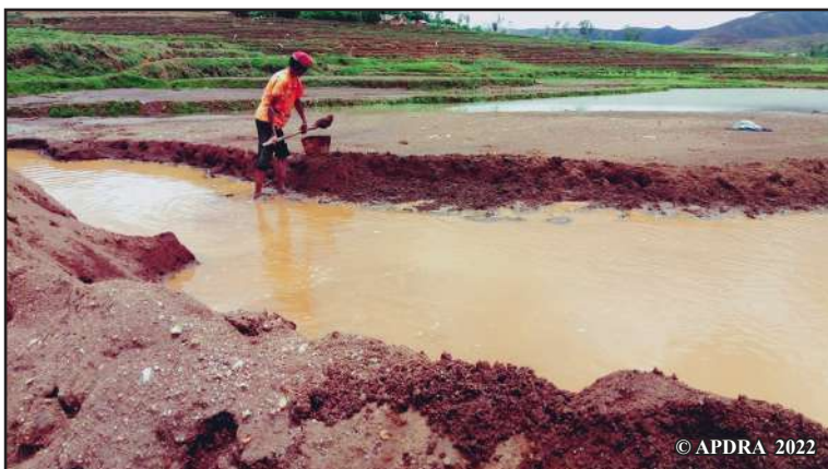
Fanotoran'ny fasika ny tanimbary

Tamin'ny volana martsa 2023, manoloana ny fahakivian'ny mpiompy trondro dia nanatanteraka atrikasa namoriana ireo mpamokatra voakasika, ny Talem-paritry ny Jono sy ny Toekarena Manga, sy ny solon-tenan'ny Sampan-draharaham-paritry ny Tontolo iainana sy ny Fampandrosoana Lovainjafy, ny kaominina ary ny tetikasa PROTANA (izay mampiroborobo ny voly anana sy hazo, tanterahin'ny FERT/FIFATA) ny tetikasa AMPIANA2, hiaraha-mitady vahaolana. Nahafahana namaritra ireo olana sedrain'ny tantsaha ihany koa io fihaonana io, izany hoe ny tokony hanarenana ny foto-drafitr'asampamokarana sy ny fividianana raiaman-drenintronro ho an'ny fotoam-pamokarana zana-trondro manaraka, ary ny hiarovana ny sahan-driaka amin'ny fasika, hanatsarana ny teknikam-pamokarana sy hampifanarahana ny tetiandrompiompiana amin'ny zava-misy.