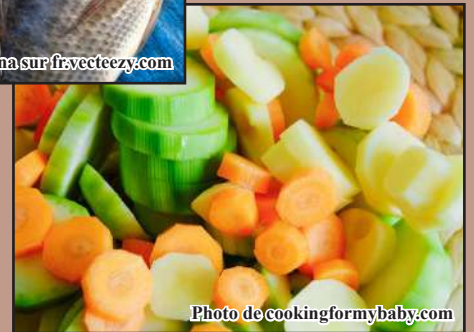
Trondro sy legioma