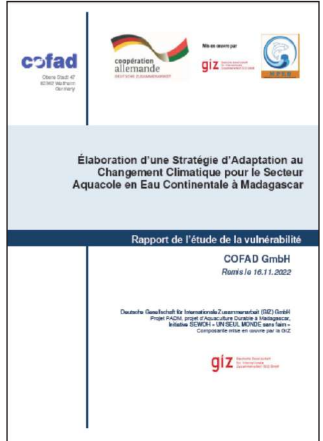
Fonon'ny boky mirakitra ny tatitry ny fanadihadiana nataon'ny GIZ

Farany, ity fanadihadiana ity dia naneho fa tonga saina amin'ny fiantraikan'ny fiovaovan'ny toetr'andro eo amin'ny sehatry ny fiompiana anaty rano ny mpamatsy vola sy ny mpanapa-kevitra ary miara-mihevitra amin'ireo mpisehatra voakasika, ny fomba tsara indrindra enti-manohana ny mpiompy trondro eo amin'ny fiatrehany ny fiovaovan'ny toetr'andro.