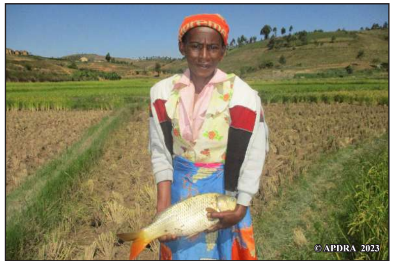
Raterazy mampiseho ny iray amin'ireo renintronrony

afaka namokatra zana-trondro. Tamin'ny 2022, 6 tamin'ireo mpanatavy fotsiny no niompy trondro. Ny sasany tsy nanao fa matahotra hain-tany toy ny tamin'ny 2021, naleony nanao voly avotra. Vahaolana noraisinay ny fanemorana ny tetiandro. Ataonay amin'ny septambra hatramin'ny desambra ny fampanatodizana raha aogositra hatramin'ny oktobra no fanaovana izany. Ny fanatavizana indray dia ny aprily hatramin'ny septambra na oktobra no anaovanay azy nohon'ny tahotry ny hain-tany sy ny tondra-drano.