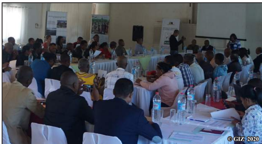
Mpandray anjara tamin'ny atrikasa

Rehefa lany ny vontootin'ny didim-panjakana dia hadika amin'ny teny malagasy ary hataon'ny DDA anaty naoty, soniavin'ny Minisitra. Aorian'ny fahazoana laharam-pamantarana avy amin'ny Primatiora no hanatontosan'ny DDA ny drafitr'asany.