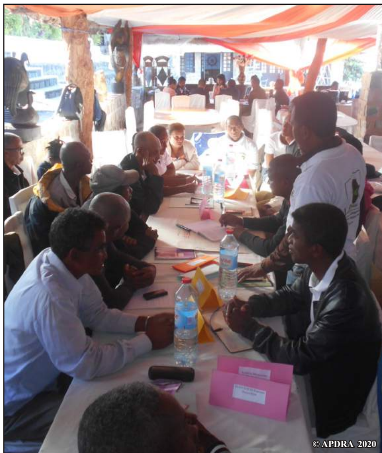
Mpandray anjara tamin'ny fivoriana fiaraha-mitady vahaolana

Tamin'ny martsa 2019, nisy fivoriana vaovao niarahana tamin'ny tantsaha maro an'isa kokoa (mpandray anjara 70), hanamafisana ny hevitra efa voaangona sy hahafahana miroso. Niaraka tamin'ny finiavana hampiakatra ny vokatra dia ny olan'ny halatra no lohalaharana tamin'ireo olana mampanahy ny mpiompy trondro. Hahafahana mamaritra tsara ny olana sy ny vahaolana, vondrona roa (iray any Avaratra ary iray any Atsimo) no niarahan'ny APDRA niasa.