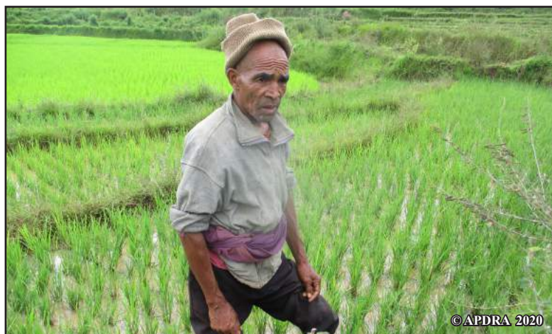
Guy eo am-pitsidihana ny toeram-pamokarany

« Antanetilava, fokontany Igararana, kaominina Miarinarivo, no misy ahy. Efa 20 taona no niompiako trondro vao niaraka tamin'ny APDRA. Isan-taona, misy mangalatra ny trondroko, ray sy renintrondro matetika. Rehefa niara-niasa tamin'ny APDRA aho dia nihena izany ary tena niato mihitsy nandritra ny roa taona. Ankehitriny anefa dia tsy azoko lazaina fa tsy misy intsony ny halatra, satria ray sy renintrondro 5, ny ankamaroan'ny ananako, no very tamin'ny taona lasa teo. Vokatr'izany dia nihena amin'ny antsasany ny vokatra zanatrondro azoko. Tsy afaka namatsy ireo mpanjifako aho ka voatery mamorona renintrondro betsaka amin'ity taona ity.