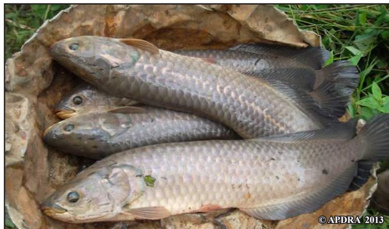
Tamin'ny taona 1962 no nampidirina ny vangolaopaka teto Madagasikara

Trondro 20 volana no nanatody voalohany. Nahitana tranga fanatodizana vitsivitsy koa anefa tamin'ireo trondro herintaona. Mety hisy ny fanatodizana betsaka (hatramin'ny 7 isan-taona) rehefa sarahina amin'ny ray aman-dreniny ny zanatondro. Mety hihoatra ny 1 000 ny zanatondro azo isaky ny fanatodizana. Hita tamin'ny fanaraha-maso natao ny tsy fihinan'ny ray aman-dreny ny zanatondro fa arovany sy fahanany « rehefa korontanina ny fotaka ary mifandrombaka miditra ao anaty fotaka ireo andian-janatondro ».