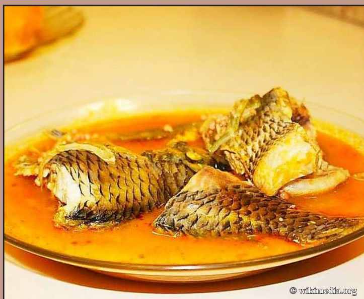
Trondro amin'ny voanio